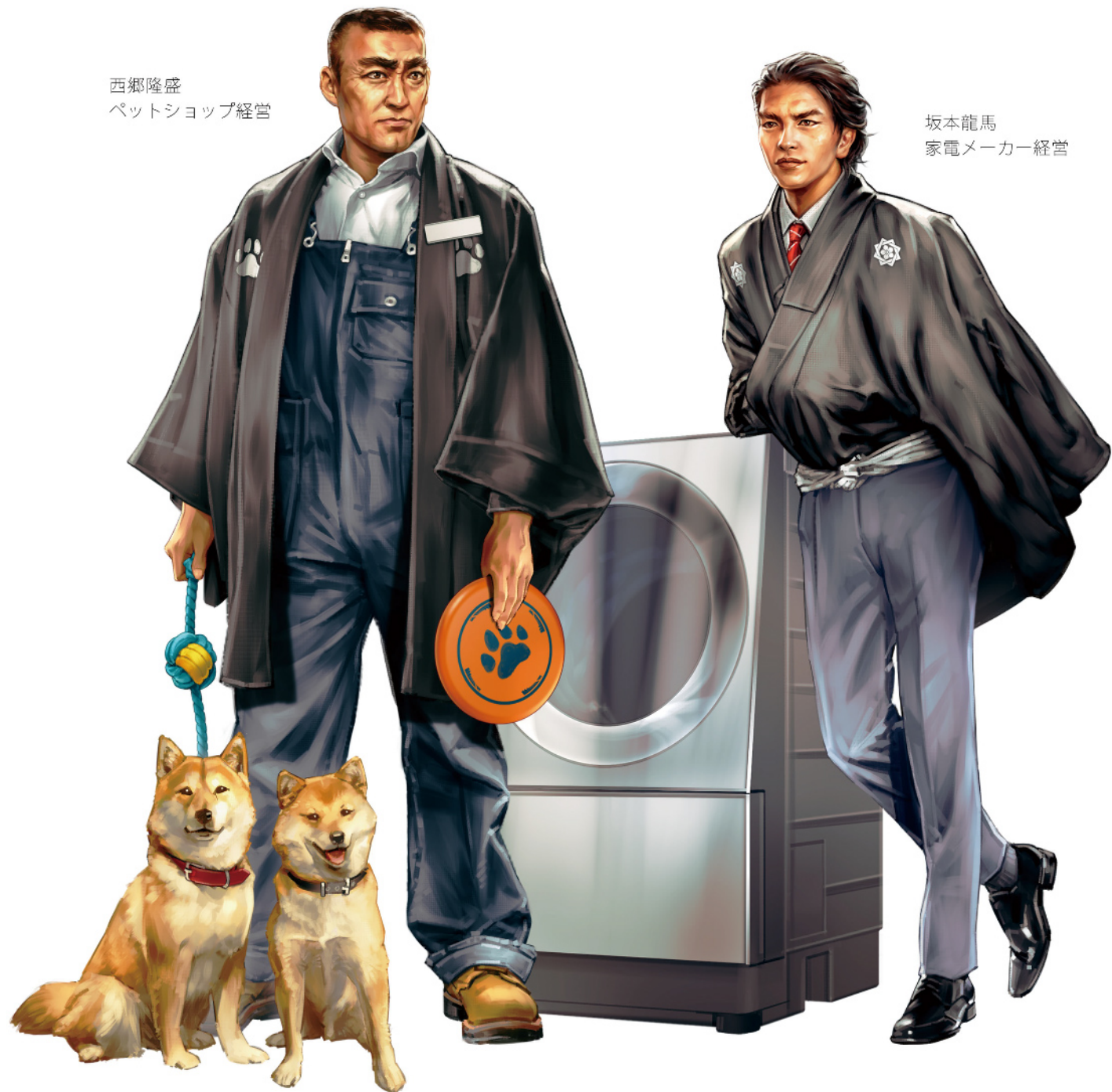
西郷隆盛 ペットショップ経営