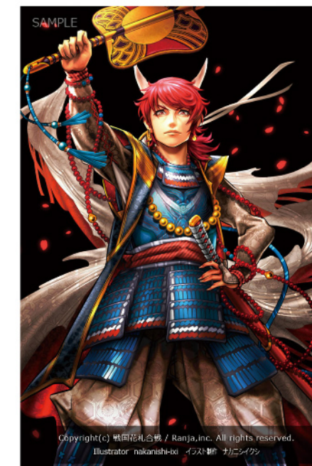
クライアント：株式会社蘭奢様 制作時間：3日～6日（イラスト1点あたり）