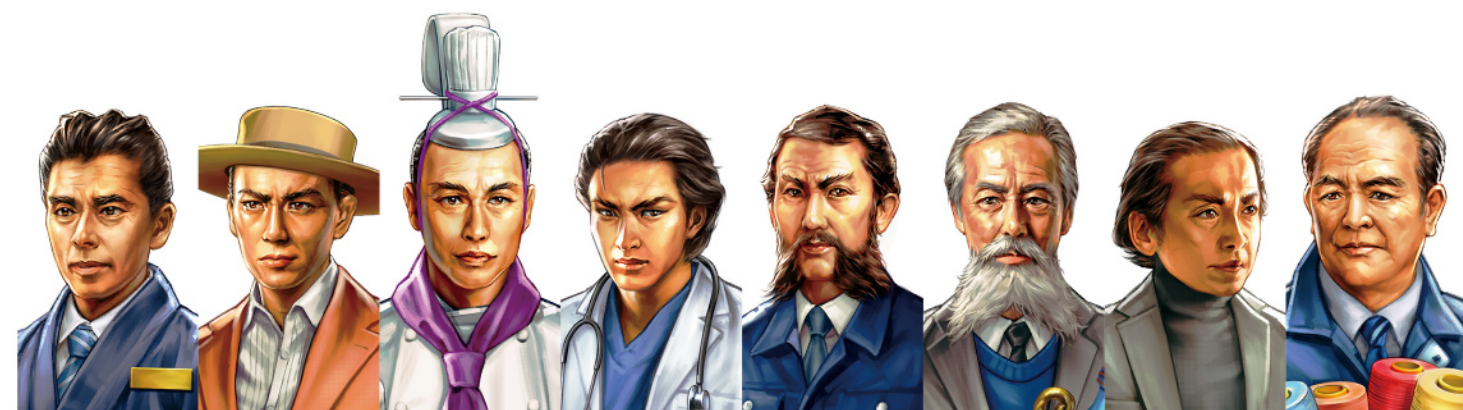
坂本龍馬 家電メーカー経営