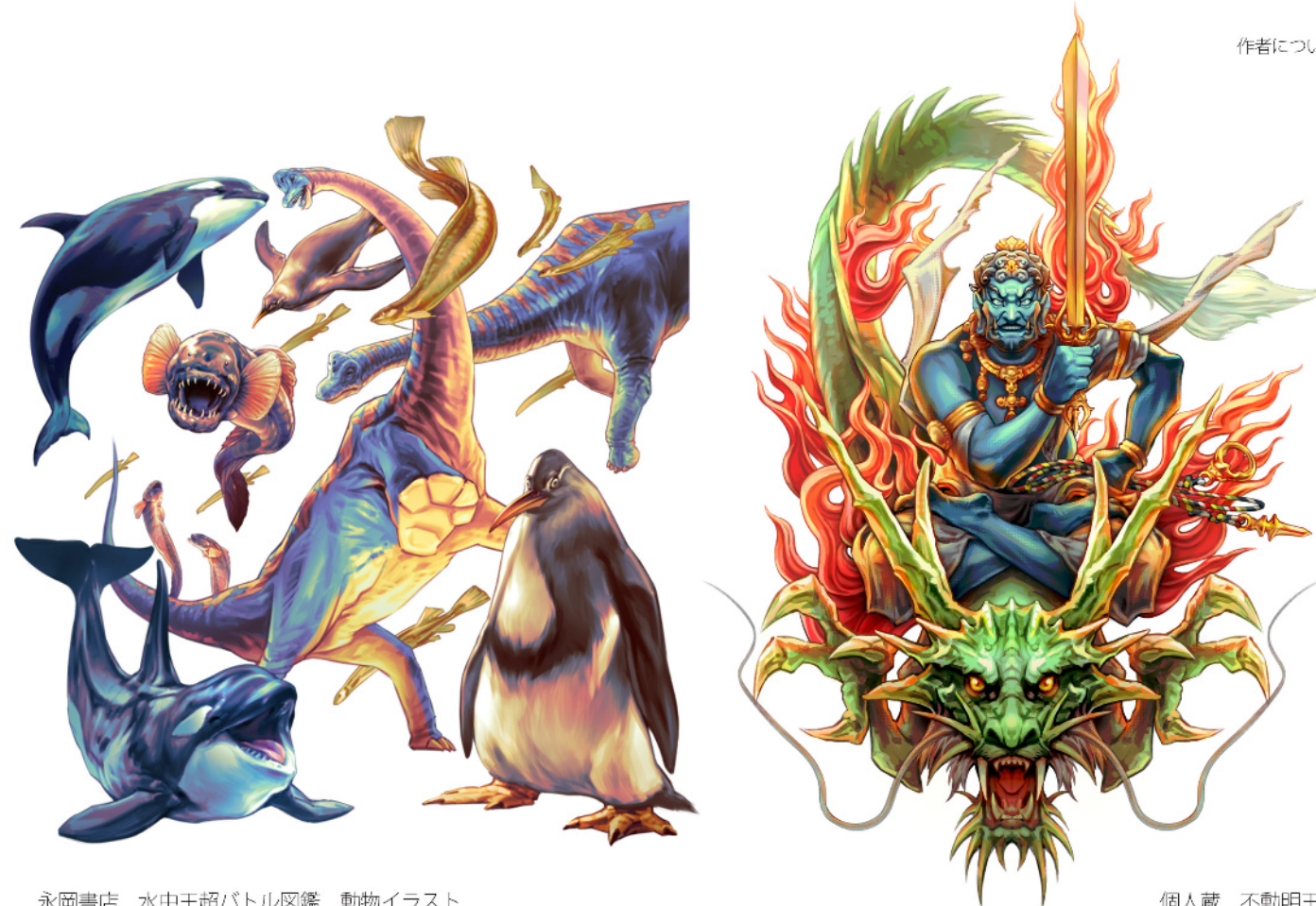
永岡書店 水中王超バトル図鑑 動物イラスト