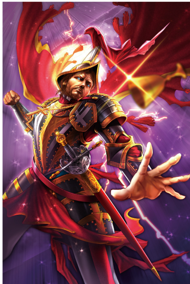
エルナン・コルテス