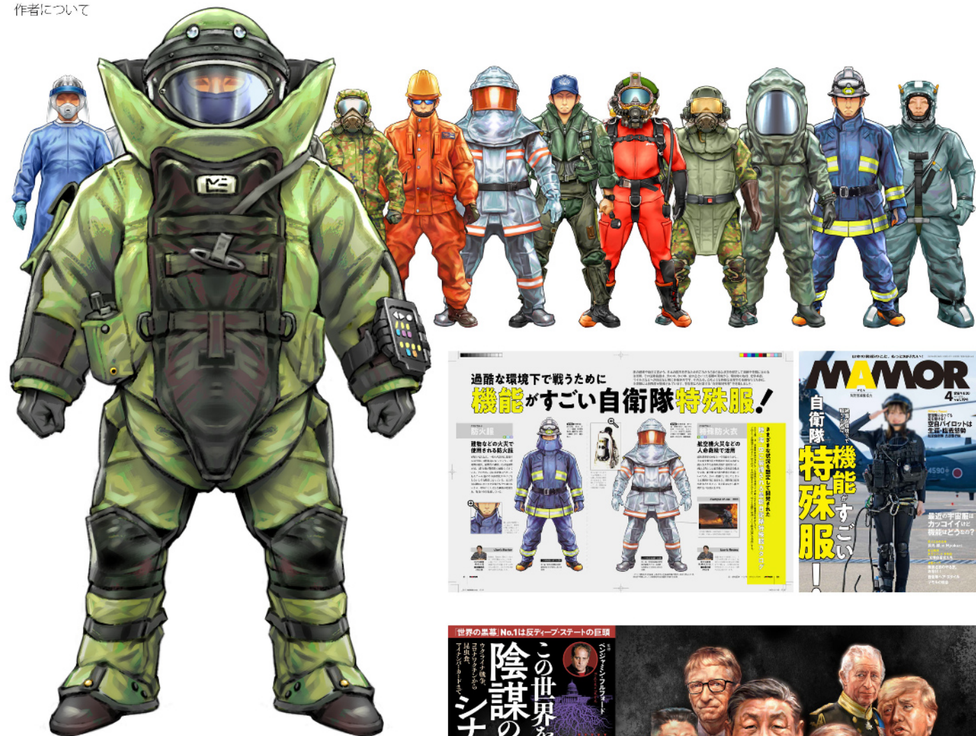
扶桑社 MAMOR 自衛隊イラスト 宝島社 陰謀のシナリオ大全 人物イラスト 永岡書店 幻獣王超バトル図鑑 獣神イラスト