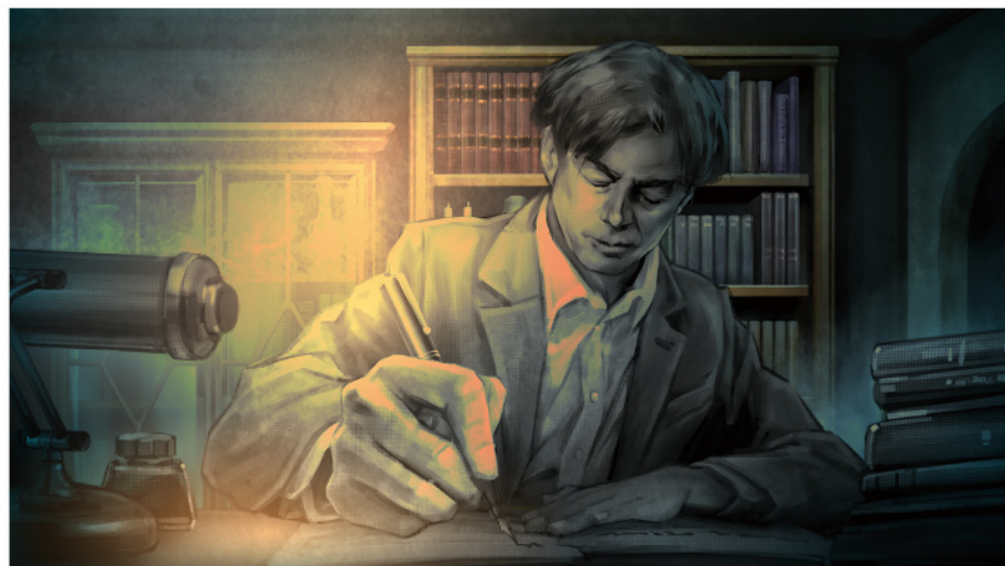
夢中で筆を執るクロウリー