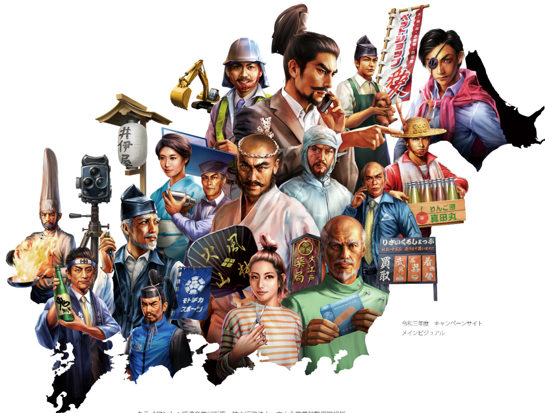
令和三年度 キャンペーンサイト メインビジュアル

クライアント：経済産業省所管 独立行政法人 中小企業基盤整備機構様 キャンペーンサイト用イラスト：中小機構に間こう！ 制作時間：2日～4日（イラスト1点あたり） 制作点数：16点程度