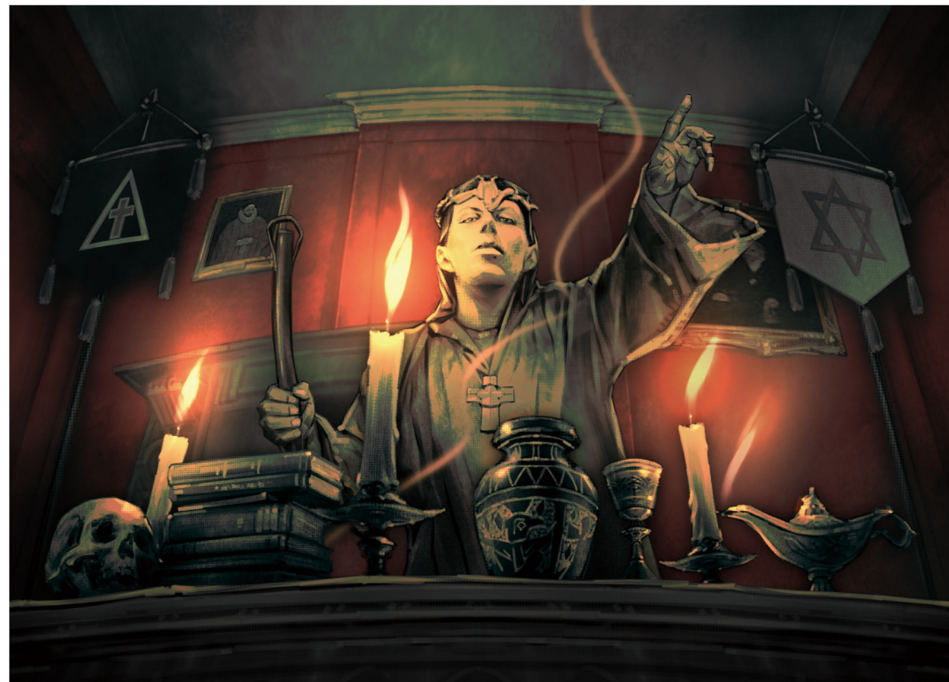
悪魔を召喚するアレイスター・クロウリー