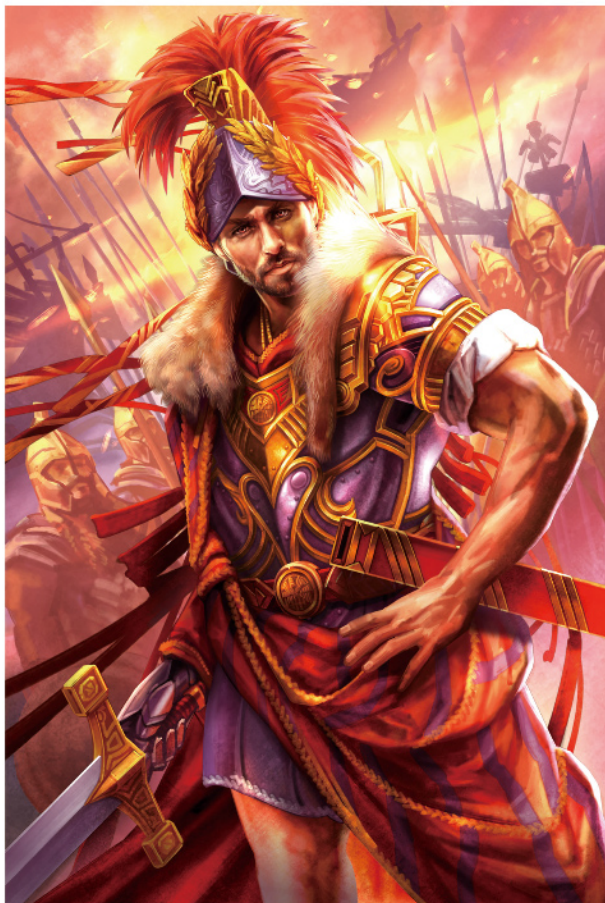
アレキサンダー大王