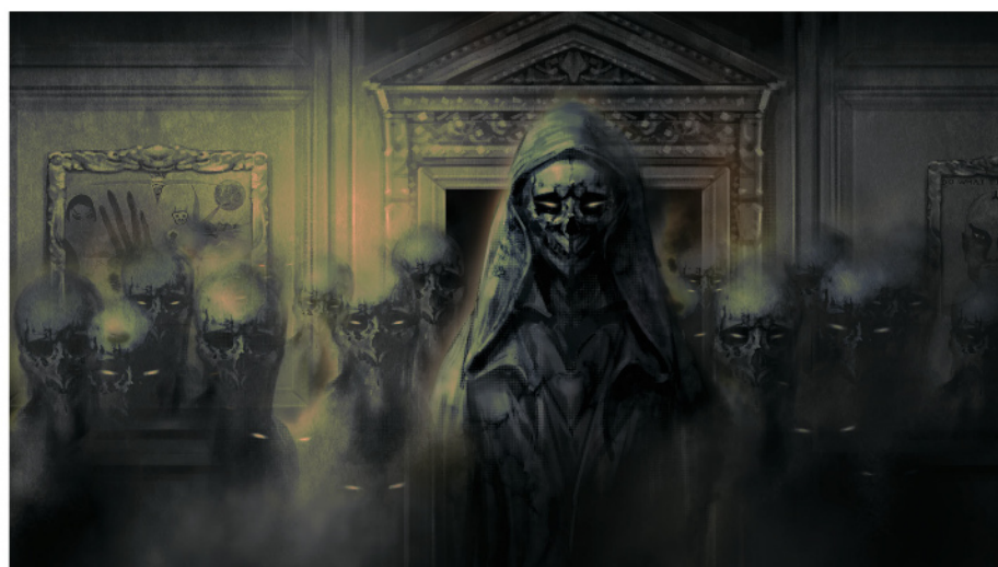
クロウリーの館に姿を現した悪魔の群れ