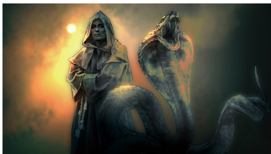
姿を自在に変える悪魔コロンゾン