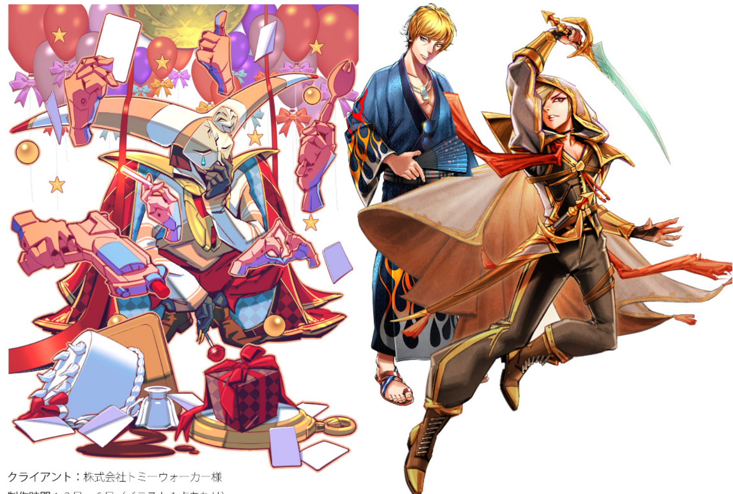
クライアント：株式会社トミーウォーカー様 制作時間：3日～6日（イラスト1点あたり）