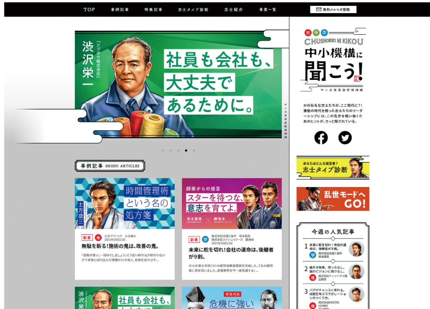
令和四年度 キャンペーンサイト

クライアント：経済産業省所管 独立行政法人 中小企業基盤整備機構様 キャンペーンサイト用イラスト：中小機構に聞こう！ 制作時間：2日～4日（イラスト1点あたり） 制作点数：16点程度