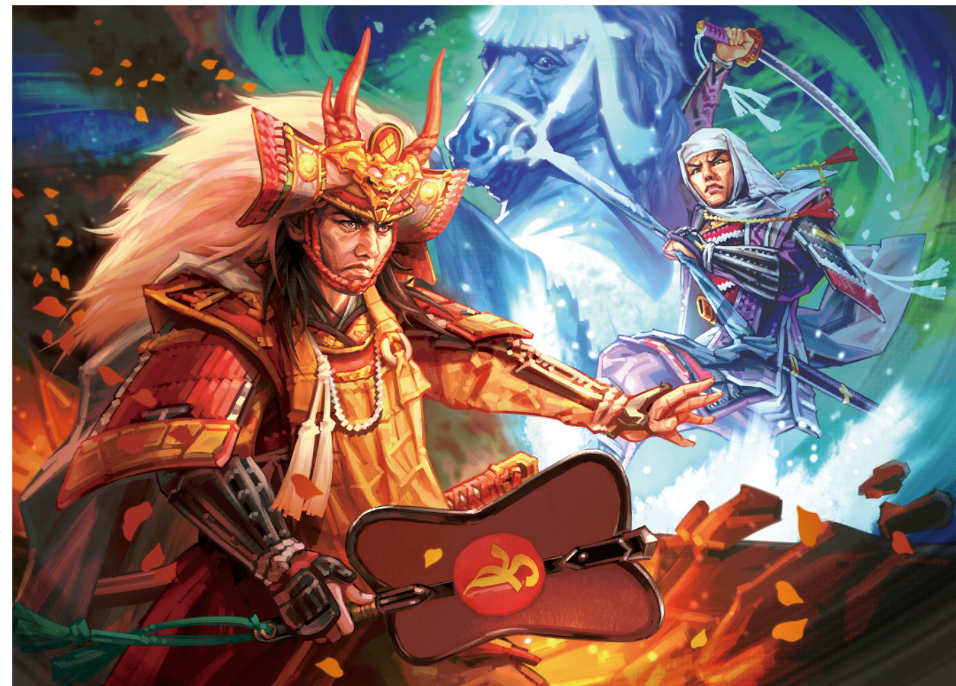
武田信玄と上杉謙信の戦い 発注単価の目安：別紙イ