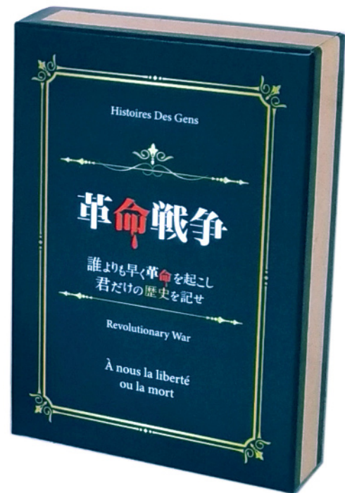
クライアント：浄水学習塾様 制作時間：3日～6日（イラスト1点あたり）